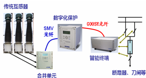
图 1 继电保护功能分散示意图