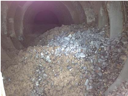
图 2 #3 湿式球磨机出料端磨筒内石灰石积聚