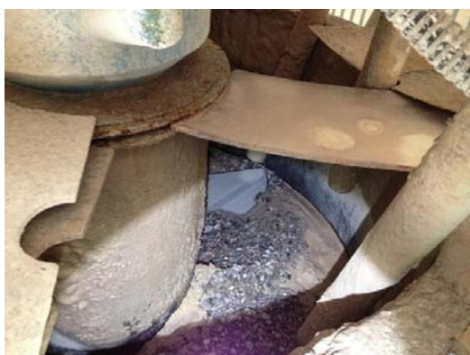
图3 #3 石灰石旋流器溢流口石灰石积聚

在#3 湿式球磨机运行电流下降较快的时间段及停运后,对系统各个部位进行了仔细检查。#3 湿式球磨机本体和电机运行声音正常、振动正常;#3 湿式球磨机出料端螺旋滤筒排污口有较大颗粒石灰石排出,出料端螺旋滤筒内部积聚大量未磨碎石灰石,如图2所示;#3 石灰石旋流器旋流子底流一半堵塞,石灰石旋流器溢流口有较大颗粒石灰石,如图3所示。