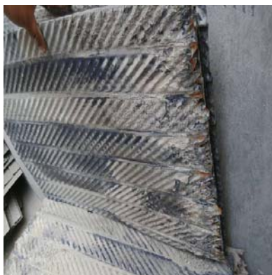
图4 空预器冷端波纹板结垢图

解包检查发现 B 空预器冷端波纹板下部结垢严重，结垢长度约 350mm 左右，如图 4 所示。