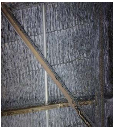
图3 空预器冷端堵塞图

B 空预器检查中发现冷端堵塞严重，有 60% 的蓄热元件的波形板已经堵死，烟气无法通过，堵塞物是硬如水泥样的块状物。堵塞情况如图 3 所示。