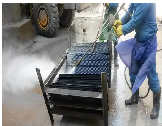
图 5 高压水冲洗图

将解包后的换热元件放在专用的冲洗架上，用高压水进行反复冲洗，直至露出搪瓷本色。高压水压力达到 18\text{ MPa} ，冲洗现场如图 5 所示。