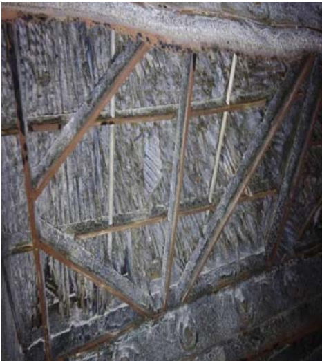
图 1 冷端传热元件盒损坏图

4 月 2 日#4 炉空预器具备检查条件, 在检查过程中发现 A 空预器冷端传热元件盒损坏严重, 冷端传元件盒由 140 块波纹板组成, 波纹板长度为 950mm, 损坏长度 50~200mm 不等, 如图 1 所示。