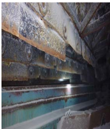
图2 空预器冷端径向密封损坏图